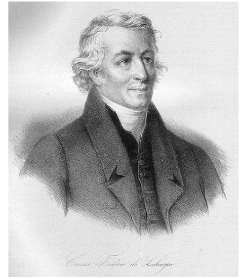
Вверху: Александр I Внизу: Екатерина II, Павел I, Фредерик Лагарп